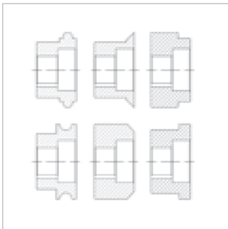
SWM 250 standard rolls